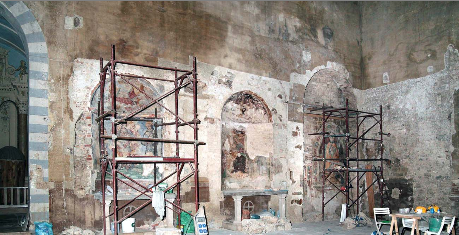
Veduta della parete destra dopo gli interventi conservativi