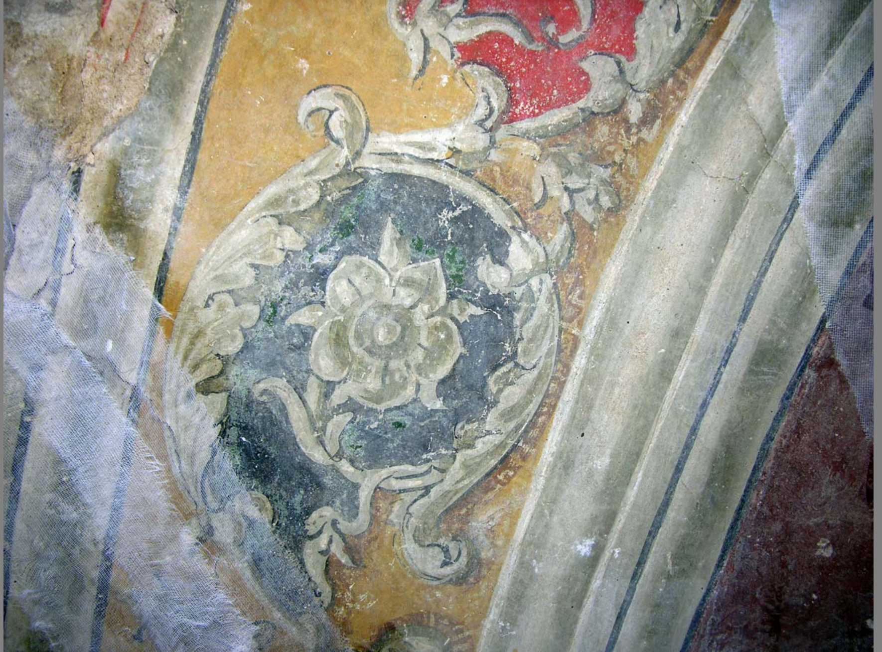
Particolare dei girali