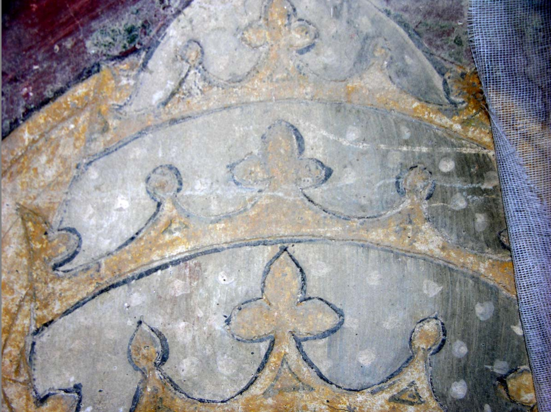
Particolare della tiara papale di s. Silvestro