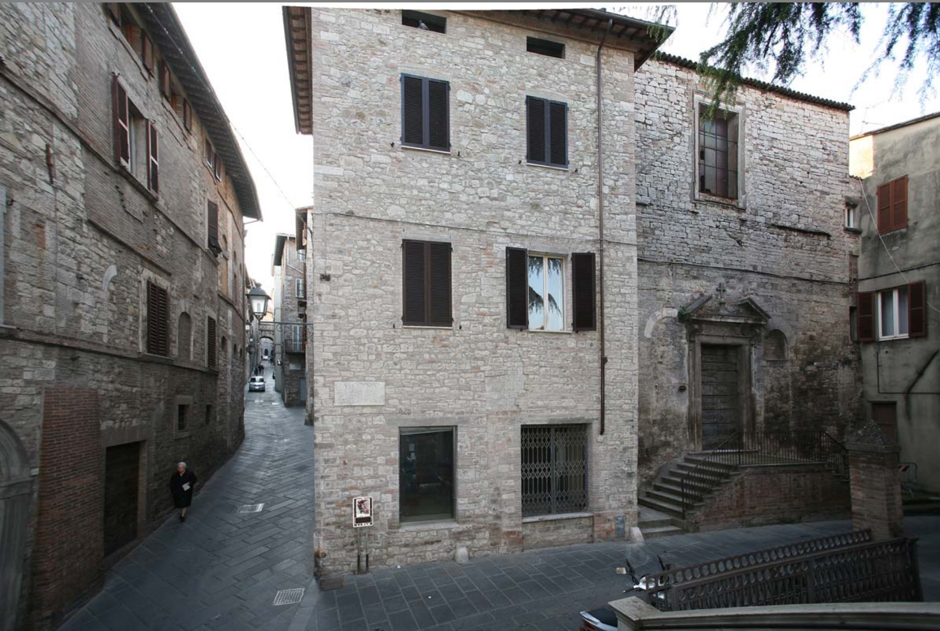
Tra il corso che scende da piazza e la trasversale via Cesia si trova la chiesa di S. Silvestro