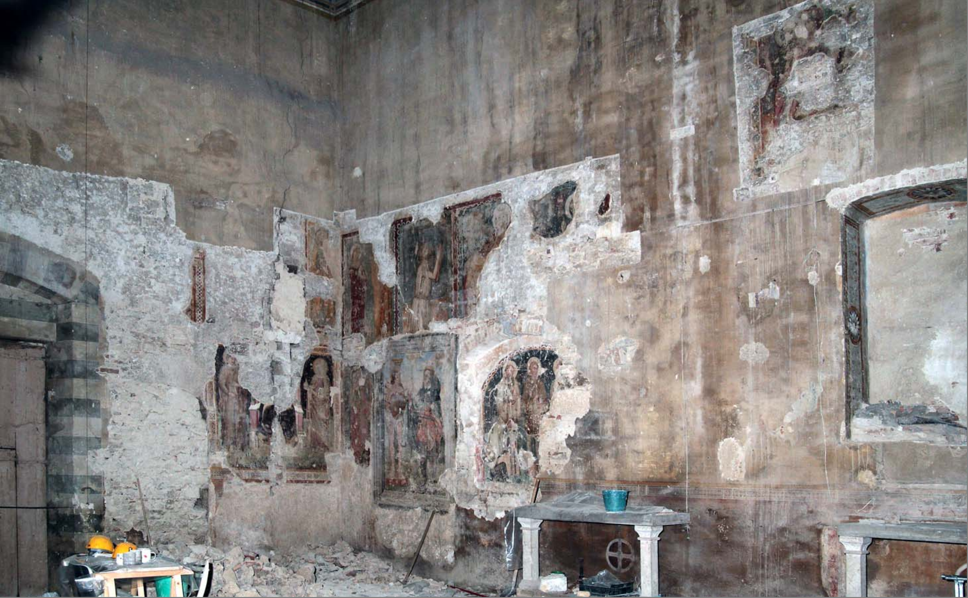
Il sistema dei dipinti murali della parete sinistra dopo l'intervento conservativo