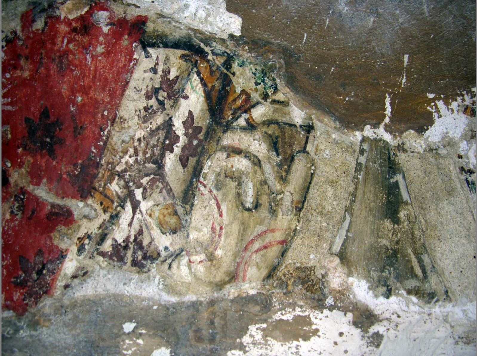
Frammento di affresco della fine del sec. XV reimpiegato con la pietra di supporto e collocato a rovescio (nella foto è nella posizione di origine)